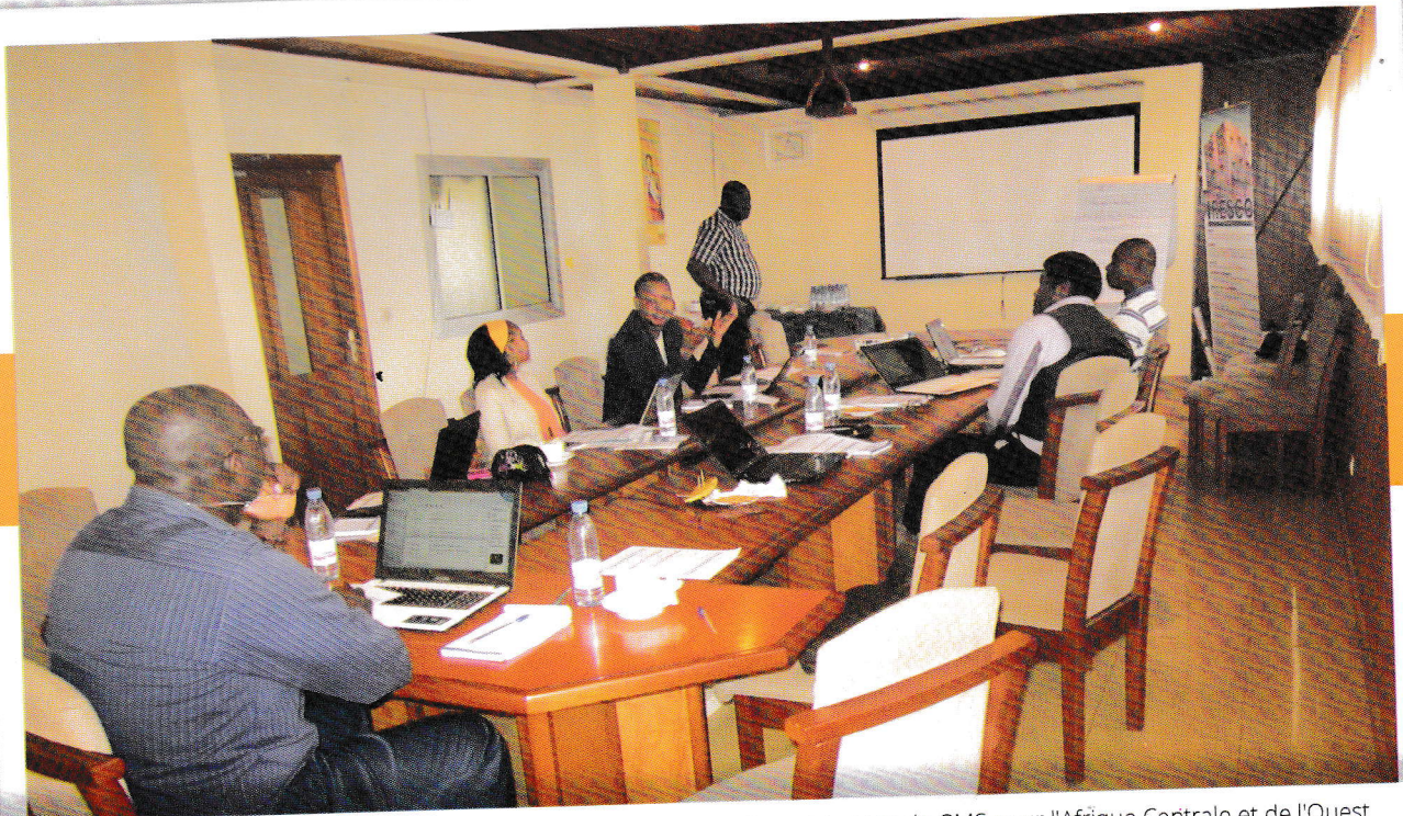
IRESCO a accueilli la 3e réunion du WAG, le groupe des partenaires régionaux de GMS pour l'Afrique Centrale et de l'Ouest

En 2016, le portefeuille pays de IRESCO a connu une extension en matière d'appui aux gouvernements et aux institutions. En effet, l'Institut a assuré la revue indépendante des programmes de coopération Pays entre l'UNFPA et plusieurs pays, dont Sao Tomé et Príncipe, la Guinée Conakry, le Cameroun, et le Gabon. C'est dire si cette activité de IRESCO occupe désormais une place de choix dans la vie de l'organisation. Cela démontre aussi la capacité de l'Institut à fournir des prestations intellectuelles de haute qualité. En effet, entre 2014 et 2016, le chiffre d'affaires de l'Assistance technique fournie par IRESCO est passé de 59 706 060 (91 021 €) à 65 142 392 FCFA (99 309 €), soit une augmentation de 9.1%.