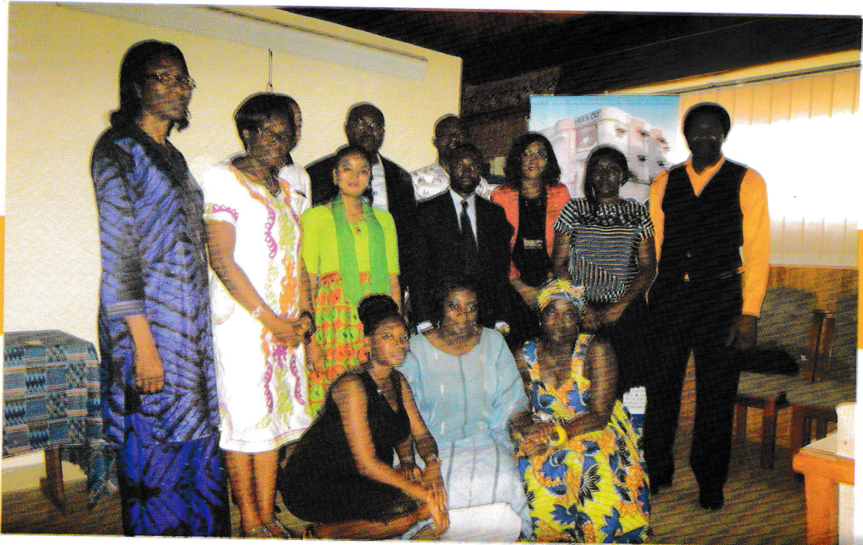
IRESCO a accueilli la 3e réunion du WAG, le groupe des partenaires régionaux de GMS pour l'Afrique Centrale et de l'Ouest